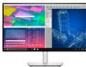
Dell UltraSharp 27-Monitor – U2722D

Arbeiten Sie von überall aus mit diesem Bluetooth Teams zertifizierten Headset, mit dem Sie problemlos zu Ihrem PC oder Smartphone wechseln und unterwegs kristallklaren Klang genießen können.