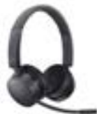
Dell Pro kabelloses Headset – WL5022

Erstellen Sie phänomenale 4K-HDR-Inhalte auf dem weltweit ersten Profimonitor mit 2K-Mini-LED-Dimmbereichen und direkter Hintergrundbeleuchtung.*