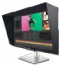
Dell UltraSharp 32-HDR-PremierColor-Monitor UP3221Q

Erstellen Sie phänomenale 4K-HDR-Inhalte auf dem weltweit ersten Profimonitor mit 2K-Mini-LED-Dimmbereichen und direkter Hintergrundbeleuchtung.*