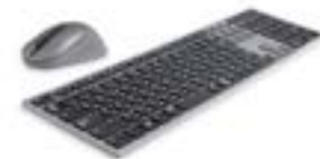
Dell Premier kabellose Tastatur und Maus für mehrere Geräte – KM7321W

SpaceMouse® Pro Wireless bietet eine professionelle 3D-Navigation, ein fortschrittliches ergonomisches Design, zuverlässige Konnektivität mit einem leistungsfähigen universellen Empfänger und vieles mehr mit einer Batterielaufzeit von bis zu zwei Monaten.