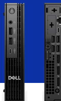
360-Ansicht entdecken >