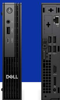
360-Grad-Ansicht erkunden >